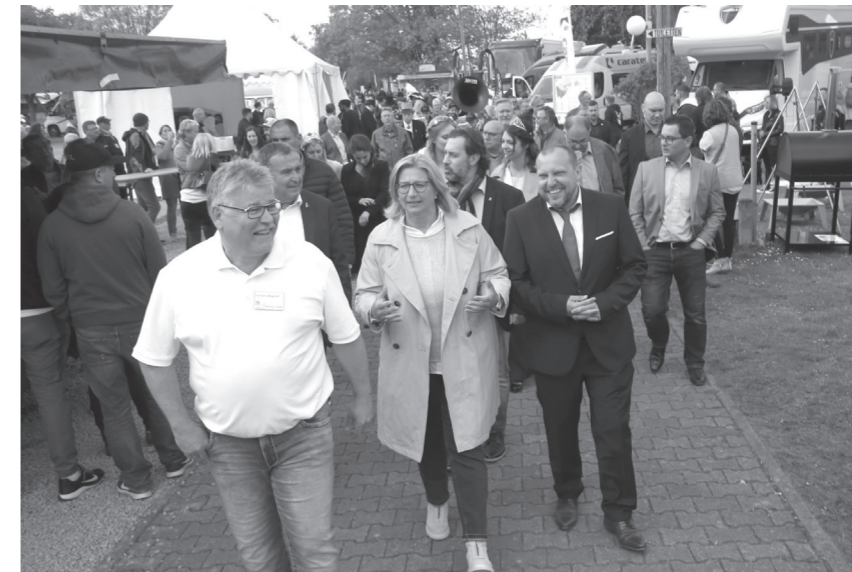
Im letzten Jahr wurde die Jubiläumsmesse „60+1“ von Ministerpräsidentin Anke Rehlinger eröffnet.

Am 29. April öffnet die Camping-Freizeit-Automobil 2023 ihre Pforten