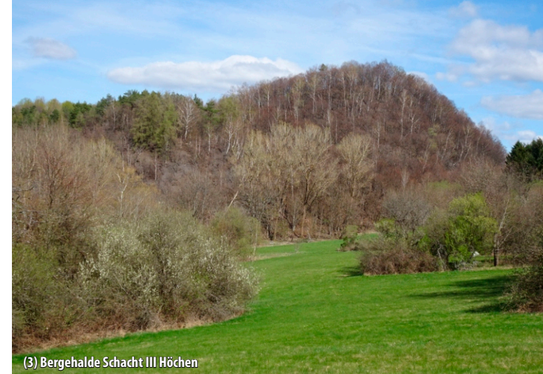
(3) Bergehalde Schacht III Höchen