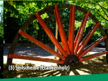
(5) Seilscheibe (Frankenholz)