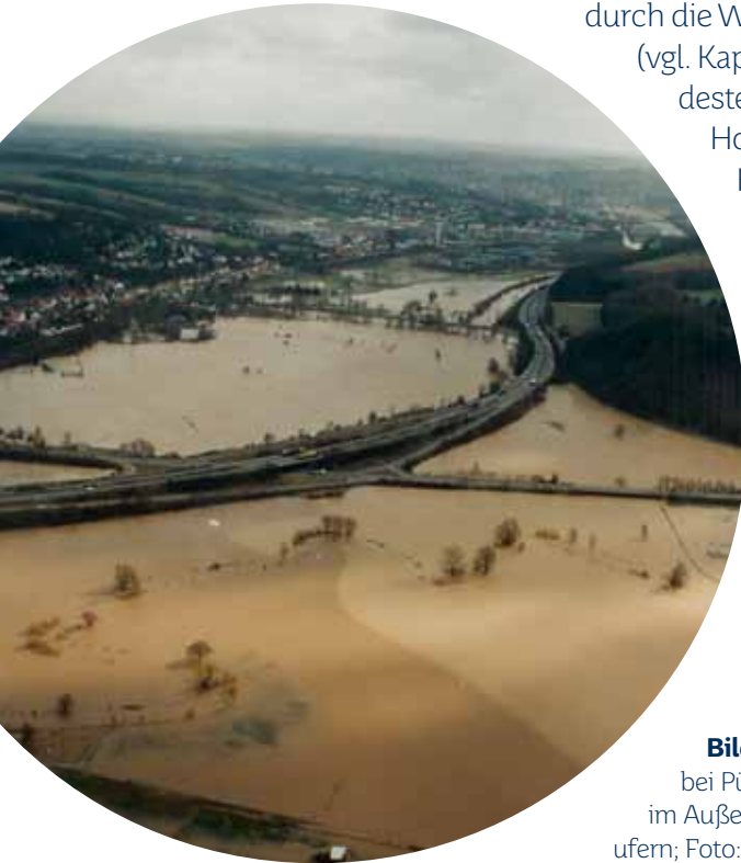
Bild Seite 6: Luftbild Schwarzbachmündung: Blies (von links kommend nach rechts fließend) und Schwarzbach (von oben kommend) in Homburg-Einöd am 27.02.1997

Die fachliche Ermittlung dieser Gebiete erfolgt durch die Wasserwirtschaftsverwaltung (vgl. Kapitel 5). Grundlage bildet mindestens das sog. „hundertjährige Hochwasser“ (HQ 100 ), also ein Hochwasserereignis, wie es – statistisch betrachtet – einmal in 100 Jahren zu erwarten ist.