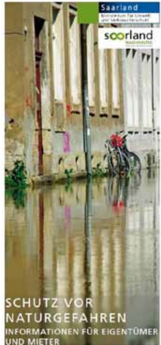
Flyer der Elementarschadens-kampagne aus dem Jahr 2015

Zusätzlich zu Maßnahmen der Bauvorsorge und Eigenvorsorge besteht die individuelle Möglichkeit, das Risiko gegen Hochwasser über entsprechende Versicherungen des Eigentums abzusichern. Eine Elementarschadensversicherung umfasst Schäden durch Hochwasser, deckt aber auch andere Risiken wie Starkregen, Erdbeben oder Schneedruck ab. Zunächst ist entscheidend, ob und wie stark Ihr Gebäude gefährdet ist. So können Sie bei Bedarf geeignete Maßnahmen zur Verminderung des Risikos einleiten. Überschwemmungen durch Flüsse und Bäche werden in Hochwassergefahrenkarten und -risikokarten dargestellt. Auf diesen Karten können Sie für Ihr Gebäude herausfinden, wie hoch das Wasser im Hochwasserfall steht. ( http://geoportal.saarland.de/portal/de/fachanwendungen/wasser.html )