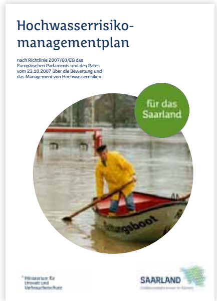
Hochwasserrisikomanagementplan für das Saarland vom Dezember 2015. https://www.saarland.de/74440.htm

Diese im Rahmen der Erstellung der Hochwassergefahrenkarten neu berechneten HQ 100 -Gebiete sind zusammen mit den Gebieten für Hochwasserentlastung und Rückhaltung als Überschwemmungsgebiete festzusetzen (vgl. § 76 Abs. 2 WHG).